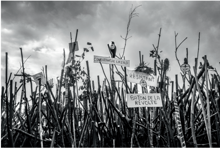
Le Chant des Bâtons, le 8 octobre 2016

aux manifestations à Nantes, une délégation venue de la zad rejoint à vélo le piquet de la raffinerie de Donges.