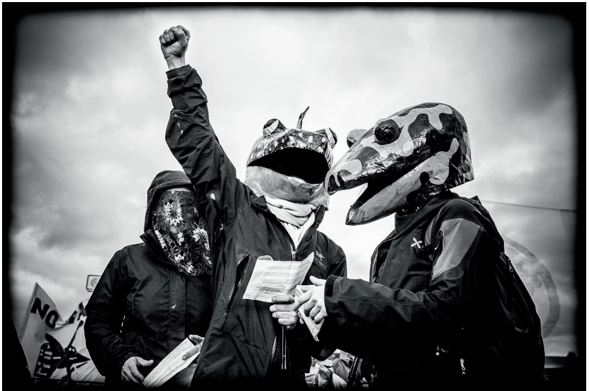
Prise de parole des occupant-e-s à l'arrivée de la manifestation anti-aéroport, à Nantes, le 22 février 2014

Face à eux, dès le début du projet, la résistance s'organise.