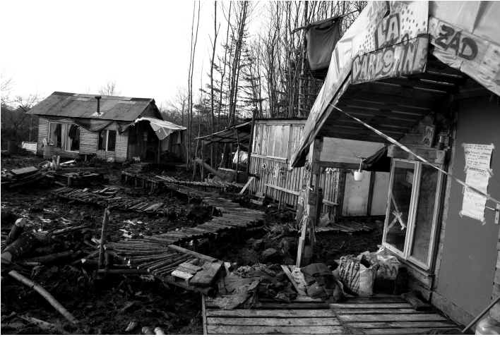
La barbotine, cabane construite à la Chat-Teigne suite à la manifestation de réoccupation par des étudiant-e-s en architecture nantais-e-s, novembre 2012

tant-e-s, majoritairement opposé-e-s au projet d'aéroport.