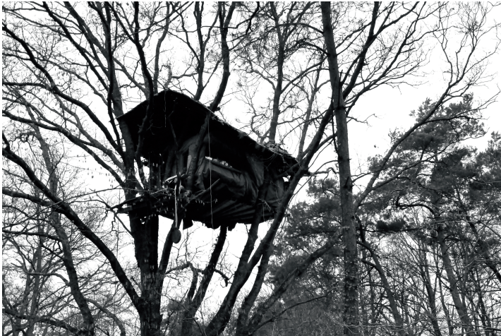
Cabane dans les arbres, forêt de Rohanne