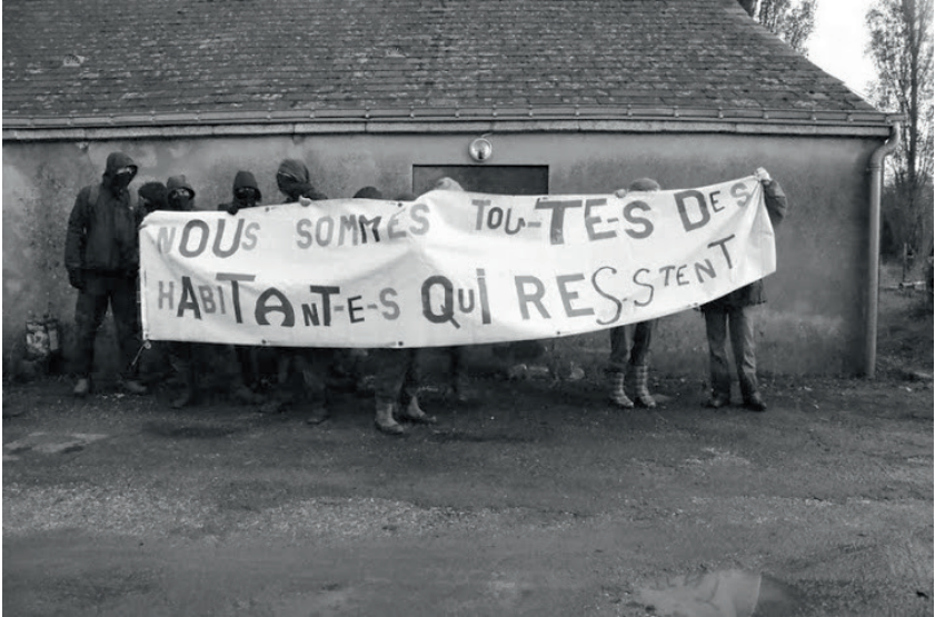
Photo prise lors de l'ouverture d'une nouvelle maison durant la première semaine de la tentative d'expulsion, octobre 2012

Nous nous retrouvons dans la grange de la Vacherit avec l'intime conviction d'avoir un rôle actif à jouer à ce moment-là. Nous avons pour armes et bagages des chaussettes sèches, des calicots, de quoi filmer l'expulsion et témoigner des violences policières, des stylos pour rédiger des lettres courroucées et des tronçonneuses pour renforcer les barricades en sacrifiant quelques arbres. Parmi nous, beaucoup d'ancien-ne-s sont encore portés par la mémoire des luttes acharnées dans la région, qui ont déjà coûté à la "puissance économique de la France" l'échec de trois projets de centrales nucléaires en 20 ans, à Plogoff, au Pellerin et au Carnet. Nous aussi, faisons face aux gendarmes, nos corps en travers de la route.