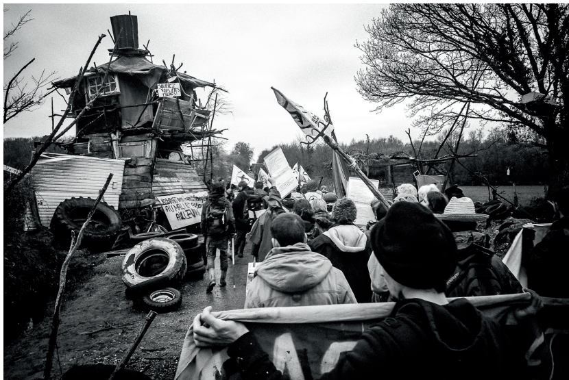
Rassemblement «Sème-ta-ZAD», le 13 Mars 2013

veaux bâtiments pour la lutte : la Chat-teigne. Les 23 et 24 novembre, des centaines de policiers tentent de reprendre la Chat-teigne et d'expulser des cabanes dans les arbres. Les grands axes de la région sont bloqués et des milliers de personnes se battent dans la forêt de Rohanne ou les rues de Nantes. Le 24 au soir, le gouvernement sonne la fin de l'opération et la création d'une "commission du dialogue". Le lendemain, 40 tracteurs viennent s'enchaîner autour de la Chat-teigne. En même temps commence une occupation policière permanente des carrefours de la zad qui durera 5 mois. Des dizaines de nouvelles personnes s'installent et une grande période de reconstruction s'amorce.