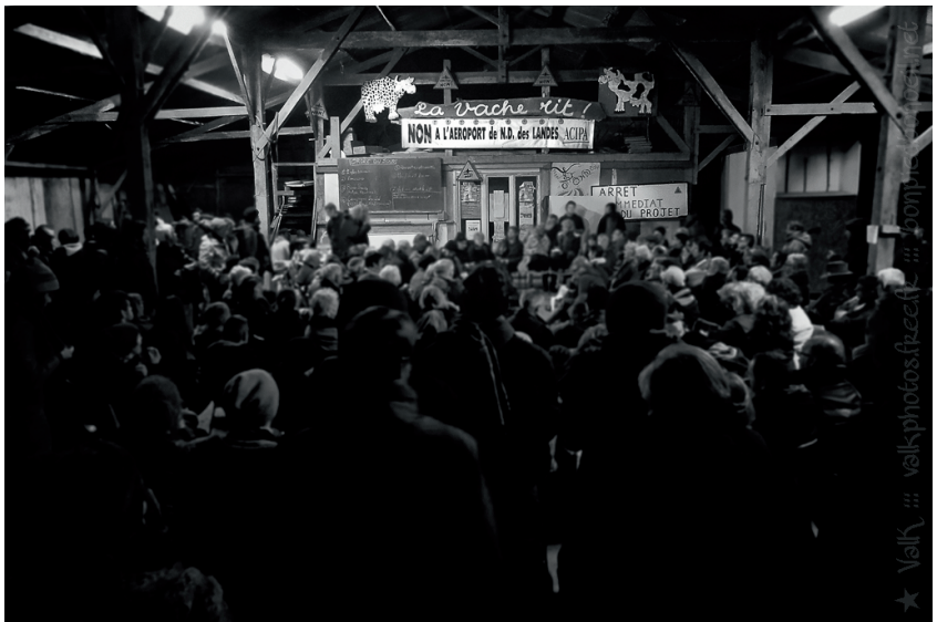
L'Assemblée Générale du mouvement anti-aéroport à la Vache-Rit, janvier 2016

Il importe donc de revenir un peu plus en avant sur ce que représente cette zone que le jeu vous invite à défendre.