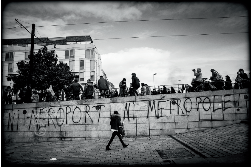
Tag aperçu à Nantes durant le mouvement contre la loi Travail, printemps 2016

France que la construction d'un nouvel aéroport» 6 . Soulignons aussi que les arguments pour délocaliser l'aéroport sont également fallacieux, ainsi le soi-disant problème posé par le survol de Nantes par les avions se posant sur l'aéroport. Des pilotes, qui ont créé un collectif de lutte contre le nouvel aéroport, ont témoigné que leurs plans d'atterrissage avaient été changés pour les faire passer au-dessus de la ville. Pratique : on crée un problème pour prétendre y apporter une solution!