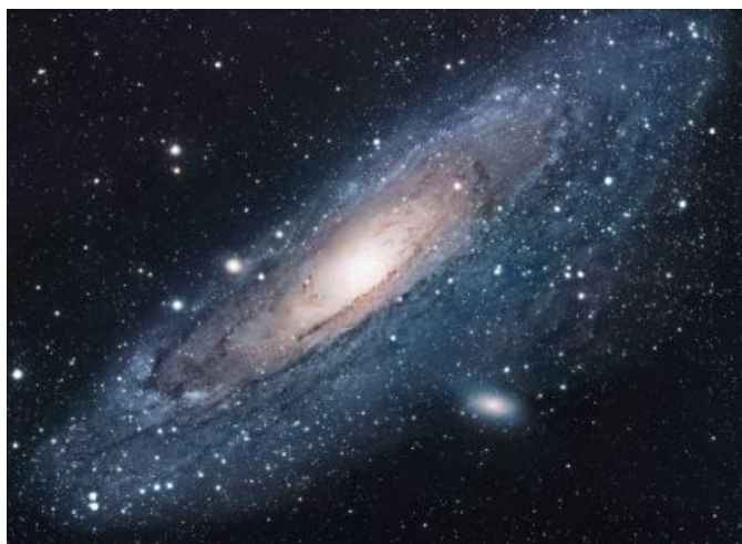
Figura 1: Pie de texto en la figura.