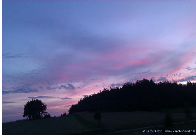
FIGURE 1: THE SKY IS THE LIMIT.