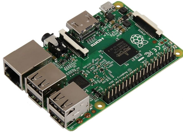
Figure 3.1: Raspberry Pi 4 Model B

placemat. Ut imperdiet, enim sed gravida sollicitudin, felis odio placemat quam, ac pulvinar elit purus eget enim. Nunc vitae tortor. Proin tempus nibh sit amet nisl. Vivamus quis tortor vitae risus porta vehicula.