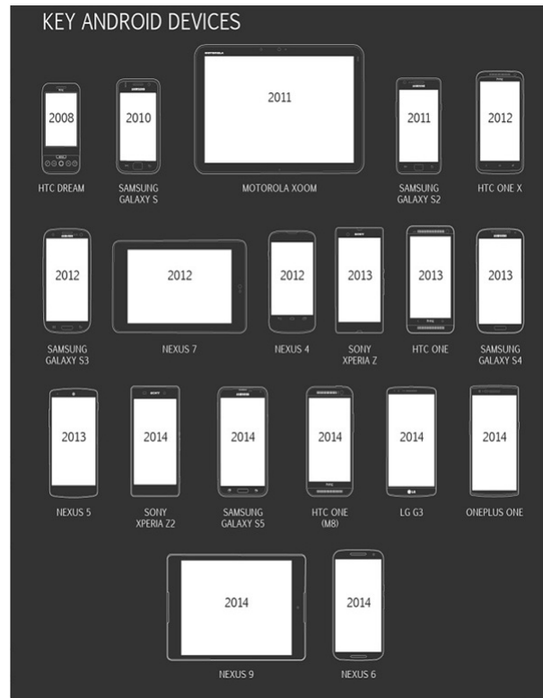
Figure 1.1 – Graphe montrant l'évolution de l'utilisation des Smartphones face aux ordinateurs de 2013 à 2015.

L A T E X (à prononcer “ La Tek” la dernière lettre est un chi, T E X comme tech) est un logiciel de composition de textes, axé vers la production de documents scientifiques et mathématiques de grande qualité typographique.