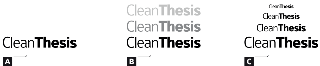
Fig. 3.2.: Another Figure example: (a) example part one, (c) example part two; (c) example part three

Lorem ipsum dolor sit amet, consectetur adipiscing elit. Etiam lobortis facilisis sem. Nullam nec mi et neque pharetra sollicitudin. Praesent imperdiet mi nec ante. Donec