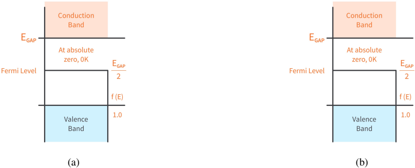
Gambar IV.2: Dengan menempatkan gambar (a) dan (b), pembaca akan lebih mudah membandingkan keduanya.