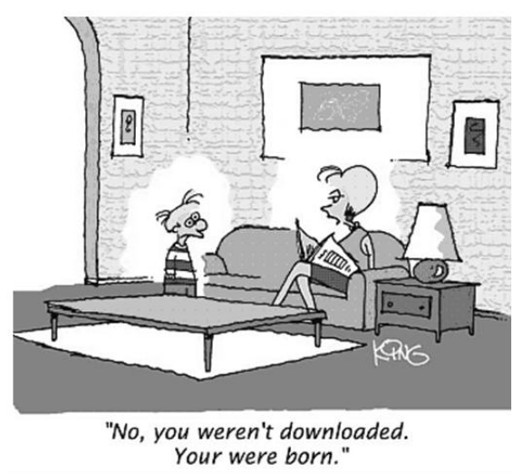
Figura 1. Uma figura típica.

As legendas da figura e da tabela devem ser centralizadas (Figura 1), justificadas e recuadas em 0,8 cm nas duas margens, como mostra a Figura 2. A fonte da legenda deve ser Helvetica, 10 pt, negrito, com 6 pt de espaço antes e depois de cada legenda.